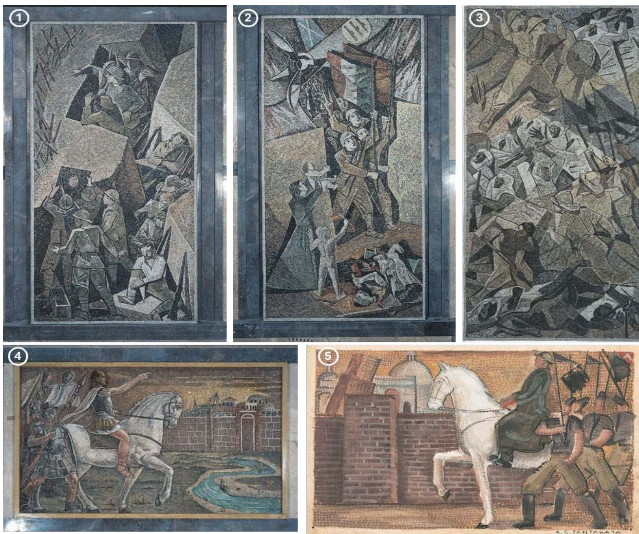
Figura 1 - Os cinco mosaicos da Casa del Mutilato di Ravenna .