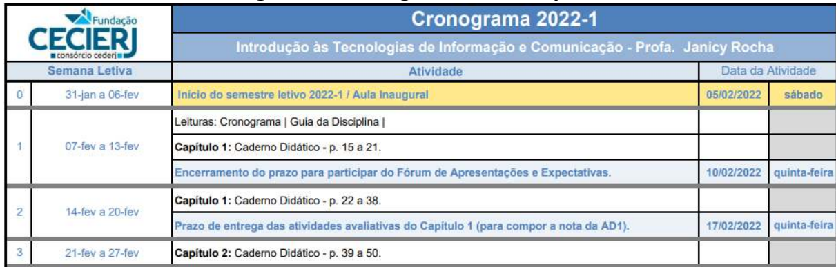
Figura 2: Cronograma de disciplina