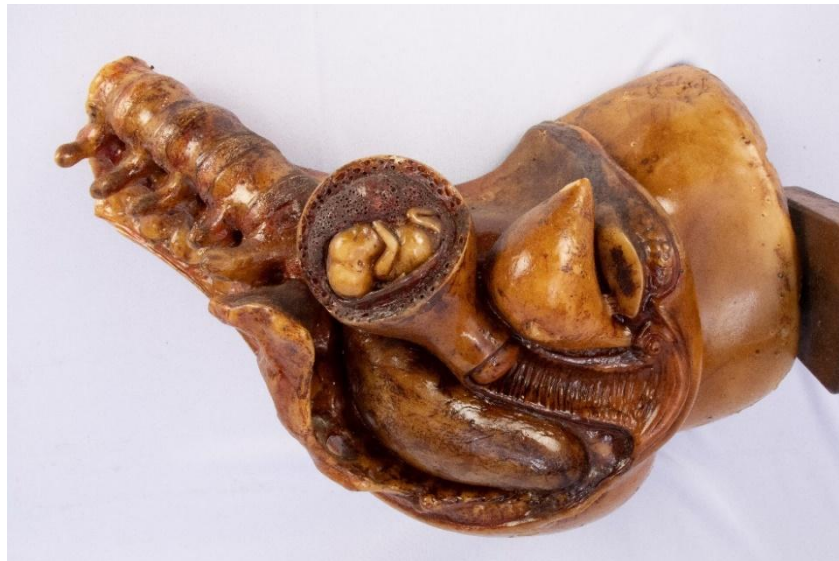
Figura 3: Conjunto “Nove meses de gestação” – 3º mês Modelo em cera de Jules Talrich