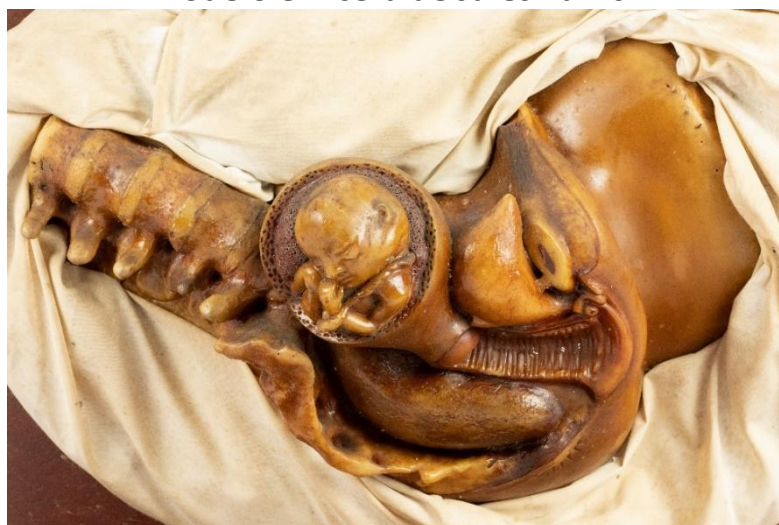
Figura 4: Conjunto “Nove meses de Gestação” – quarto mês Modelo em cera de Jules Talrich

Os dedos e os artelhos do embrião se distinguem e o cordão umbilical começa a formar-se em espiral. A vesícula umbilical continua a atrofiar-se. (Nesta peça e nas seguintes as membranas caduca e amnios foram arrancadas em grande parte a fim de melhor se ver o desenvolvimento do feto) (Faculdade de Medicina do Rio de Janeiro, 1913, p. 122)