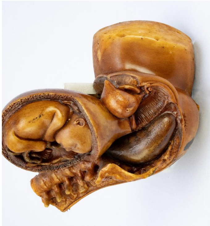
Figura 6 : Conjunto “Nove meses de Gestação” – sexto mês Modelos em cera de Jules Talrich