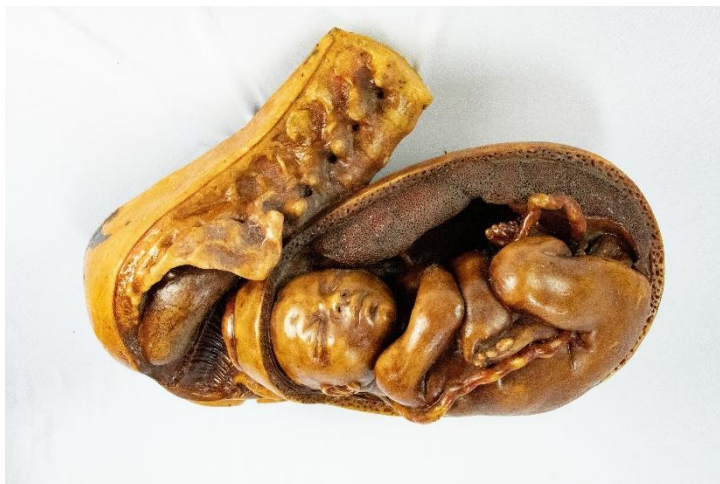
Figura 9: Conjunto “Nove meses de Gestação” – nono mês Modelo em cera de Jules Talrich