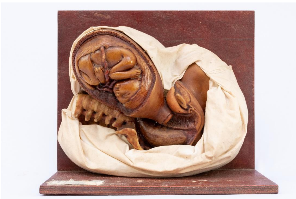
Figura 7: Conjunto “Nove meses de Gestação” – sétimo mês Modelo em cera de Jules Talrich