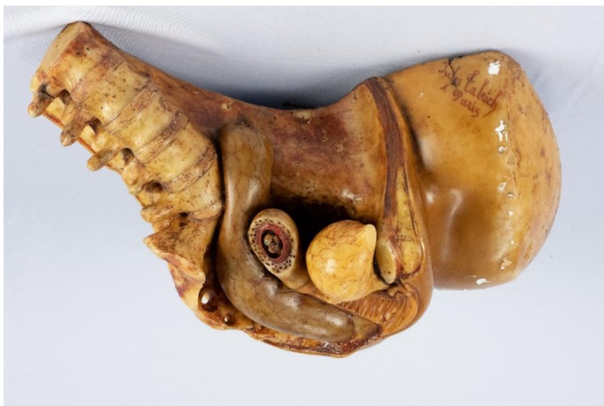
Figura 1: Conjunto “Nove meses de gestação” – 1º mês Modelo em cera de Jules Talrich

Desde 2019, o conjunto é parte de uma exposição intitulada Museu de Anatomia Por Dentro do Corpo , que ocupa o corredor do Laboratório Anatômico do Instituto de Ciências Biomédicas e é integrada por cerca de “200 peças anatômicas humanas (ossos, órgãos e músculos), reais (material biológico plastinado), produzidas no Instituto em sua Unidade de Plastinação”. A ação é promovida pelo “Projeto de Extensão Ciência para a Sociedade” (Carvalho, 2019, p. 140). A ficha que acompanha o modelo apresentado na figura 1 informa que a peça foi restaurada em 1936 por Aldo Baldissara. As descrições das peças que compõem o conjunto apresentado nas figuras de 1 a 9 foram extraídas do Catálogo do Museu Anatomo-Pathologico.