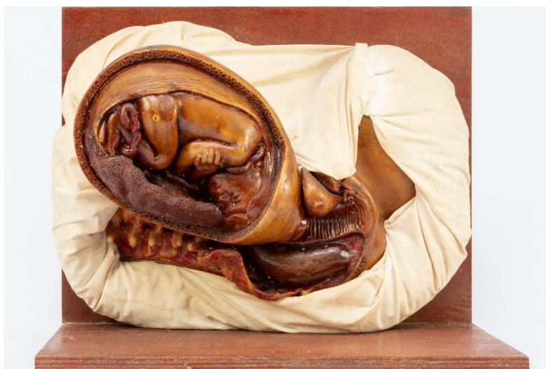
Figura 8: Conjunto “Nove meses de Gestação” – oitavo mês Modelo em cera de Jules Talrich

No oitavo mês de gestação (figura 8), “[...] o amolecimento do collo do utero é completo e a dilatação da cavidade do colo muito adiantada” (Faculdade de Medicina do Rio de Janeiro, 1913, p. 123). O modelo que representa o nono mês (figura 9) é assim detalhado na publicação: “Na ocasião da parturição o feto tem attingido todo o seu desenvolvimento, a dilatação do collo é completa e deixa ver a membrana caduca que forma a bolsa das águas” (Faculdade de Medicina do Rio de Janeiro, 1913, p. 123).