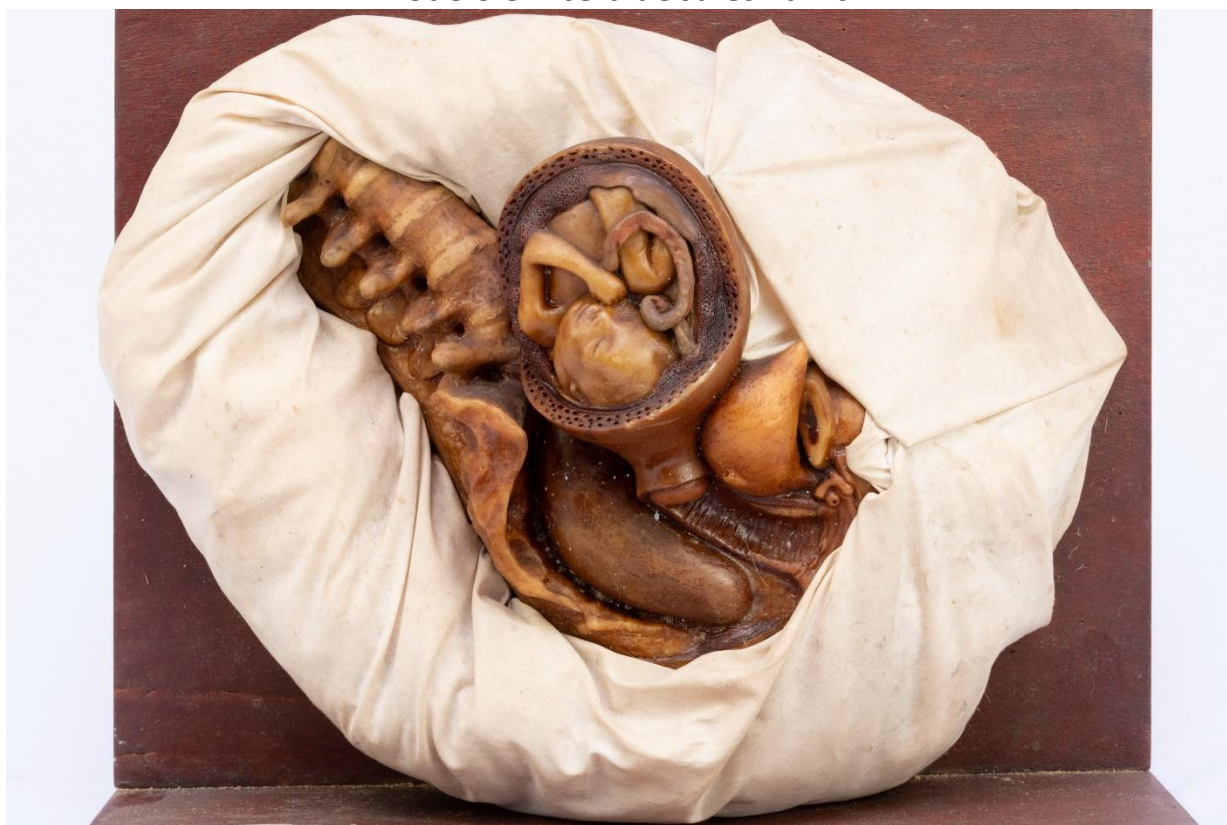
Figura 5: Conjunto “Nove meses de Gestação” – quinto mês Modelo em cera de Jules Talrich

No quarto mês de gestação (figura 4), “[...] o embrião toma o nome de feto; o sexo torna-se aparente, as unhas visíveis, as fontanelas grandes e alguns cabellos alvos começam a aparecer”. No quinto mês (figura5), “[...] o feto continua á desenvolver-se, seus movimentos que começam a ser percebidos no fim do 4º mez, tornam-se mais pronunciados” (Faculdade de Medicina do Rio de Janeiro, 1913, p. 122).