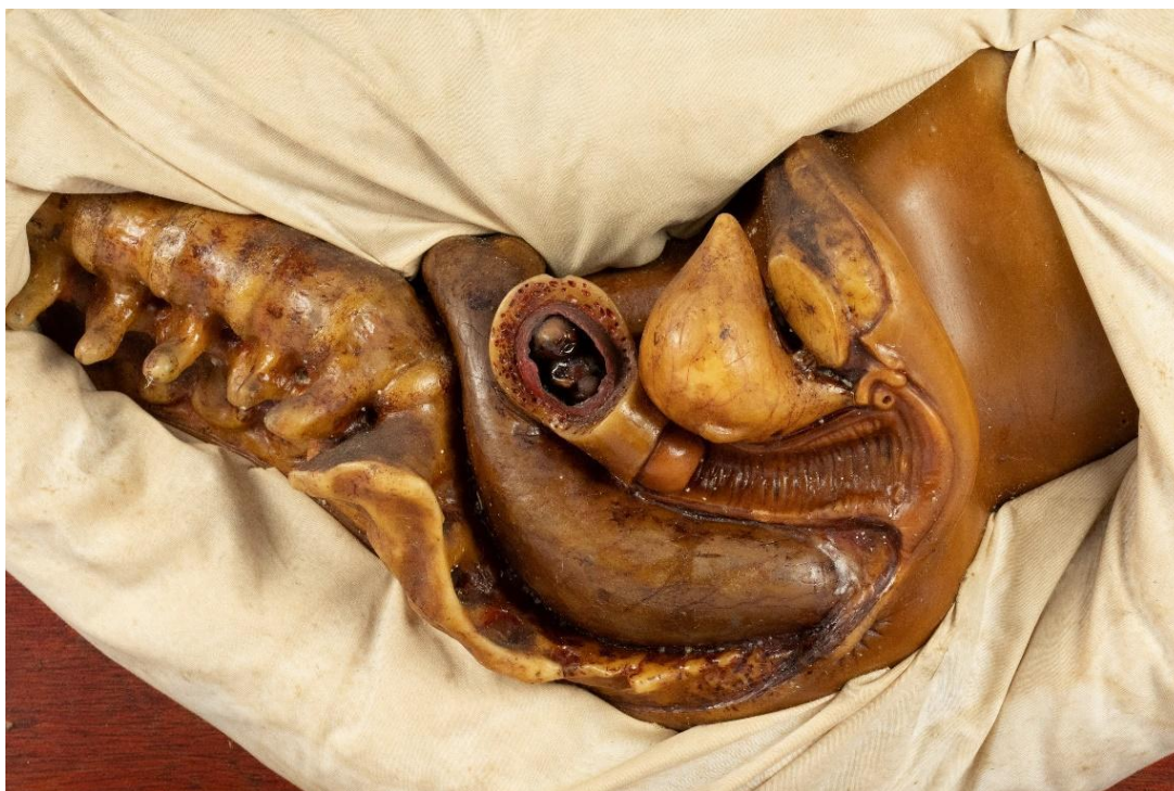
Figura 2: Conjunto “Nove meses de gestação” – 2º mês Modelo em cera de Jules Talrich

A cavidade do collo uterino começa á dilatar-se, mas é só nos últimos mezes da gravidez que esta dilatação se faz completamente. Nas mulheres primíparas este trabalho se faz só no momento da parturição (Faculdade de Medicina do Rio de Janeiro, 1913, p. 121).