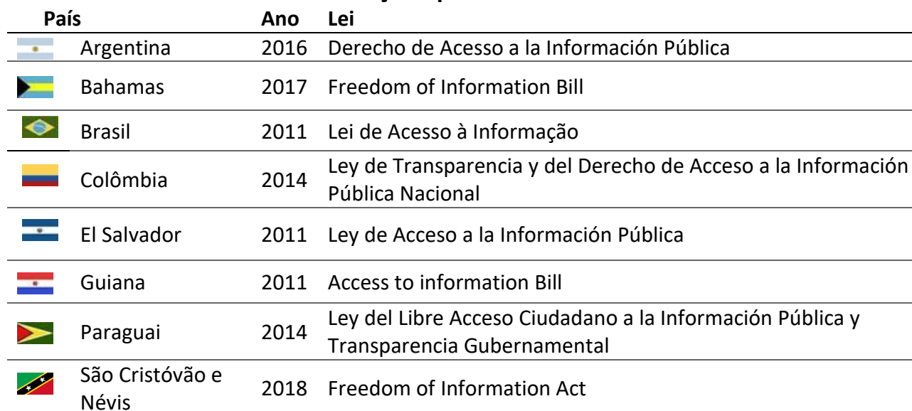
Tabela 2: Países do continente americano que instituíram leis de acesso à informação após o ano de 2010

A Tabela 2, a seguir, revela quais países latino-americanos, membros da OEA, adotaram leis de acesso à informação após 2010.