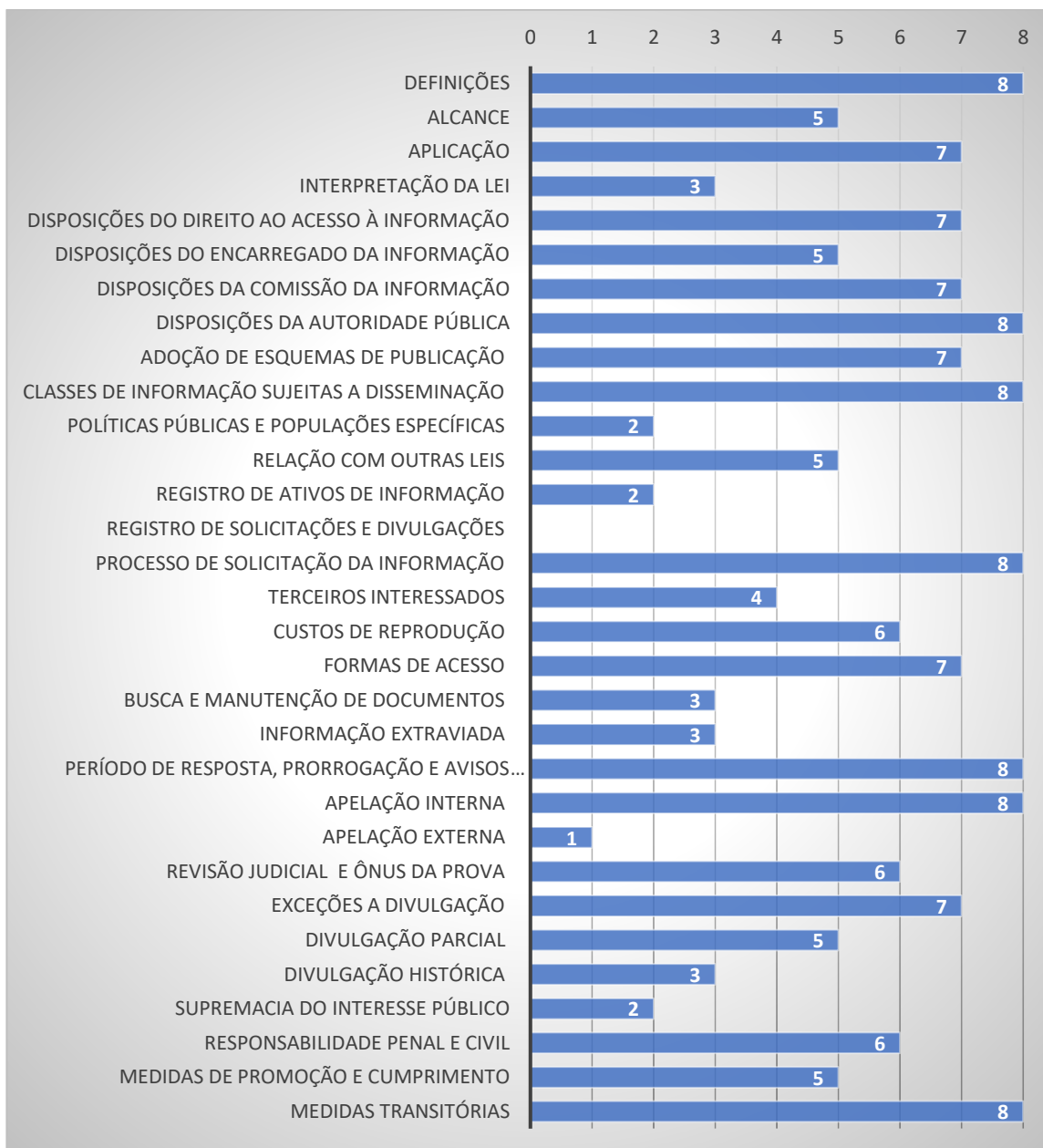
Gráfico 2: Correspondência das Categorias Temáticas