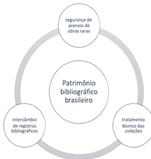
Figura 3: Discussão sobre patrimônio bibliográfico no Brasil