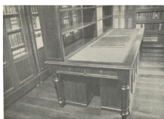
Figura 2: Mesão do Gabinete Branco

Ainda, como elementos da materialidades dos saberes, as grandiosas estantes do Salão pois, de acordo com Pyne (2016, p. [53], tradução nossa), “estantes de livros estão entre alguns dos acessórios mais óbvios para transmitir autoridade, vantagem e status social”; e, a grande mesa do Gabinete Branco (Figura 2) cuja funcionalidade foi comparada a roda de livros projetada pelo engenheiro italiano Agostino Ramelli no século XVI (Figura 3), já que ambos dispositivos possibilitaram “[...] otimizar a relação entre os movimentos do pensamento, do olhar e da mão” (JACOB, 2014, p. 78, tradução nossa).