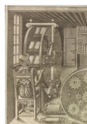
Figura 3: Roda de Ramelli