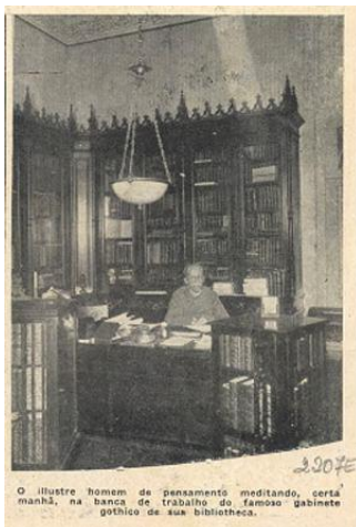
Imagem 1: Rui Barbosa no Gabinete Gótico