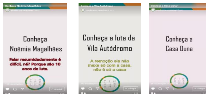
Figura 2: Instantâneos da tela de três transmissões da IGTV de @pindorama_exposicao