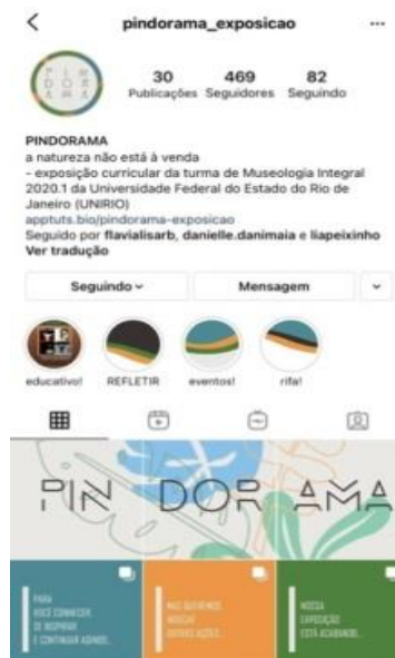
Figura 3: Feed do Instagram de @expo_pindorama