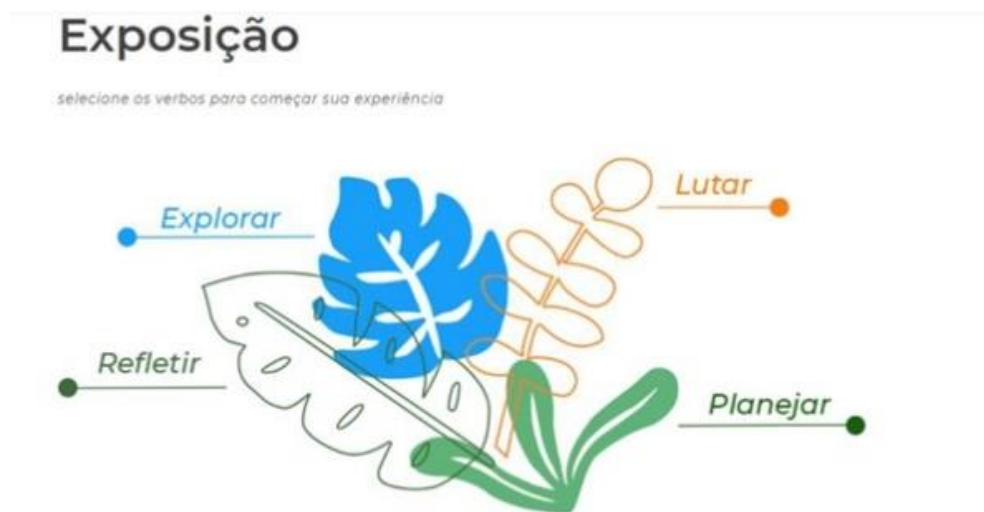
Figura 4: Figura que dá acesso à exposição no sítio eletrônico

provocar os públicos não somente a “se engajar” nas mídias sociais, mas também intervir na narrativa da exposição. Exemplos disso são as publicações no Feed “Nós conversamos sobre...”, “Vamos conversar?” e “E eu com isso?”, além de diversos Stories. Seria possível explorar muitos outros aspectos relacionados ao uso do Instagram como meio para interlocução e espaço expandido da exposição “Pindorama”, entretanto, em razão da limitação de páginas deste artigo, passamos à experiência de “Montações”.