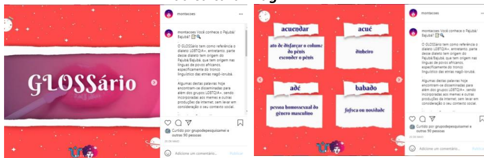
Figura 5: Publicação GLOSSário, dedicada à liguagem como expressão de resistência da cultura Drag