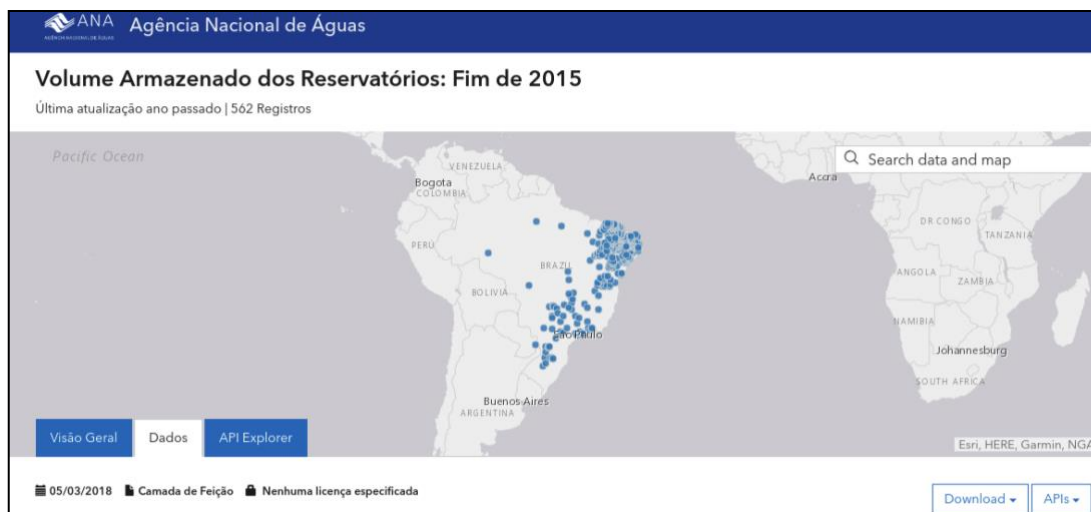
Figura 2 - Portal de dados Abertos da Agência Nacional de Águas

Destaca-se que o site de dados abertos da ANA possui um visualizador que exibe os conjuntos de dados (Figura 2) conforme as coordenadas em um mapa, facilitando a compreensão dos dados, e também possui uma API onde os dados podem ser recuperados.