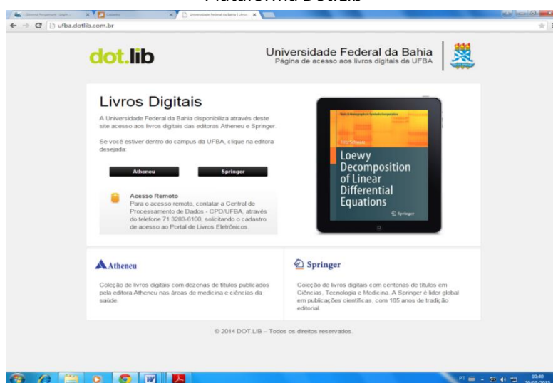
Figura 2 Plataforma Dot.Lib

Conforme se pode observar na Figura 1, na homepage do SIBI/UFBA há o link “Livros digitais assinados pela UFBA”. Através deste link , o usuário é remetido para a homepage da Dot.Lib, distribuidor de conteúdo online científico e acadêmico de várias editoras nacionais e internacionais, plataforma a partir da qual se realiza o acesso aos livros eletrônicos da Universidade Federal da Bahia, conforme demonstra a Figura 2.