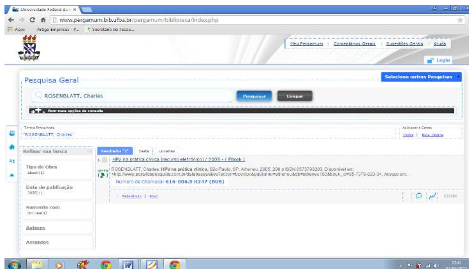
Figura 3 Acesso aos livros eletrônicos a partir do Catálogo on-line da UFBA