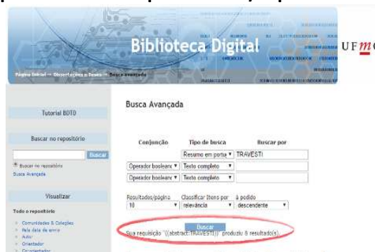
Figura 1: Exemplo de busca campo: Resumo/expressão de busca “Travesti”

Todas as 16 palavras-chave foram testadas nos três campos de busca.