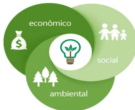
Figura 1: Pilares do Desenvolvimento Sustentável

A Figura 1 a seguir apresenta os três pilares da sustentabilidade.