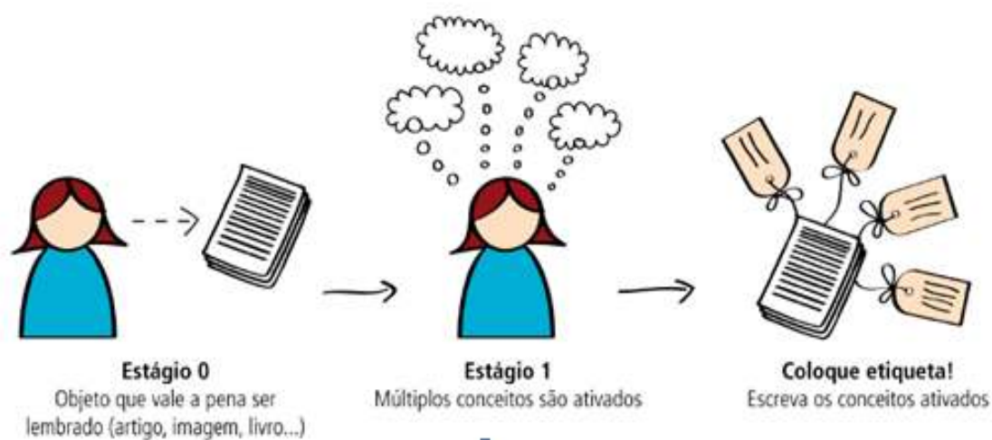
Figura 1 - Processo cognitivo por trás da etiquetagem

Sinha (2005) estuda o processo cognitivo por trás da etiquetagem e menciona que o primeiro estágio é correspondente à seleção de um objeto/conteúdo informacional por parte do usuário, em seguida ocorre a comparação da equivalência entre o conteúdo e os conceitos ativados na sua estrutura mental e, logo em seguida, efetua-se a descrição por meio da etiquetagem - conforme é ilustrado por Brandt (2009) na Figura 1.