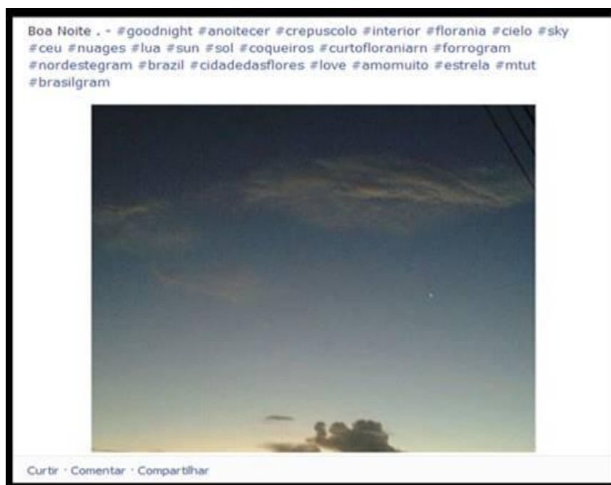
Figura 2 - Atribuição de tags em foto disponível no facebook